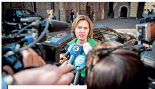
Minister van Infrastructuur en Waterstaat Cees van Nieuwenhuijzen praat met de pers over de afwijking van rekeningrijden te voorkomen.

DEB BAAS - Het kabinet pakt er af met een toezegging van rekeningrijden te voorkomen. Dat liet VVD-minister Cees van Nieuwenhuijzen (Infrastructuur) weten aan De Telegraaf na een oproep van de omgelden Mobiliteitsalliantie.